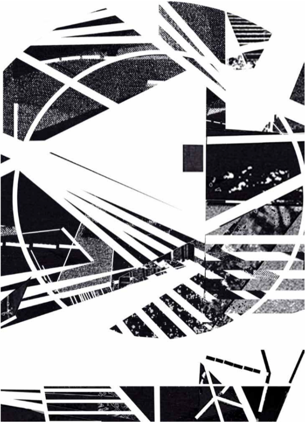
Attilio Terragni, 156/157 - MEDITATION ON LIGHT AND SHADOW ACRILICO E CHINA SU CART

C'è un momento nell'astrazione in cui la stessa è come se procedesse autonomamente, per un suo volere intrinseco. E' un momento che non arriva per