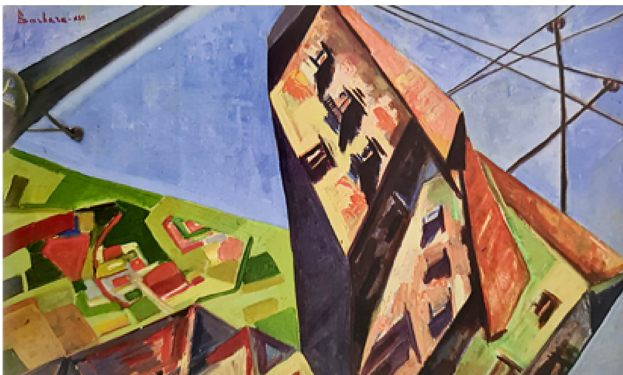
Vomito dall'aereo, 1938, olio su cartone intelaiato, 40 x 59,5 cm