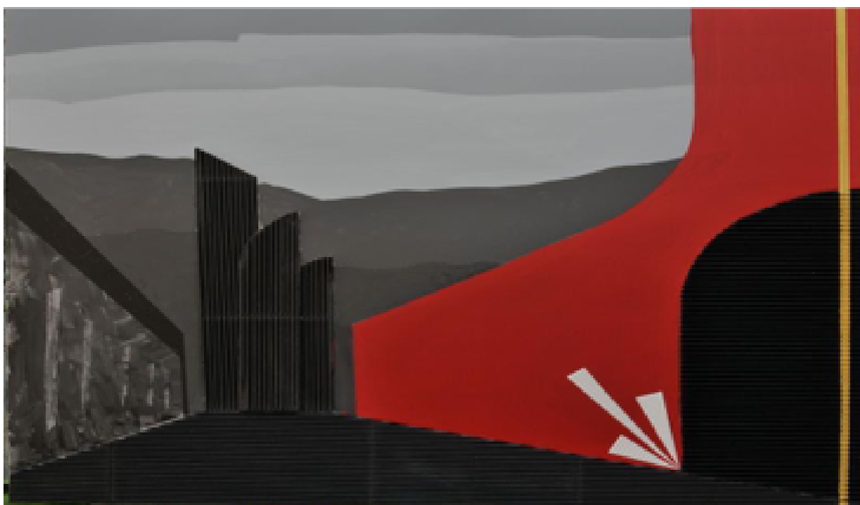
Michele Longo, Composizione 100x80 2018

In questa fase prevale il tema del paesaggio che, memore dell’antica militanza sperimentale, è raffigurato fuori da ogni intento naturalistico; si tratta della valle del Tevere ai piedi del monte Soratte, i luoghi dove l’artista ha scelto di vivere, protagonisti di un percorso di attraversamento visivo il cui tema prevalente è lo sconfinamento, la ricerca di un senso ulteriore nella relazione tra la presenza dell’umano e la natura. Qui Longo lavora sulle stratificazioni (terra, nuvole, cielo) che, come da lezione impressionista, tendono a confondersi, a rimanere indefinite; come se la traccia della storia, prevalentemente affidata a segni orizzontali o verticali di colore nero e rosso che si stagliano sul verde e sul grigio del paesaggio, si connettesse e fosse tutt’uno con la natura. Compito dell’arte immaginare nuove connessioni, ibridazioni, possibilità di senso, partendo da una percezione all’inizio affidata alla fotografia, quindi materializzata negli strati di colore. Si tratta di uno scenario da cui è assente il pathos, cui l’artista preferisce la messa in scena di un campione di possibilità che esclude la responsabilità di un pronunciamento. Né vi è alcuna indulgenza nel gioco o nella citazione, soluzioni predilette dalle poetiche post avanguardiste. Longo si limita a mettere sulla tela un potenziale racconto di cui egli stesso non conosce l’esito, il che ci porta all’altra costante di questo lavoro: la cancellazione dell’io.