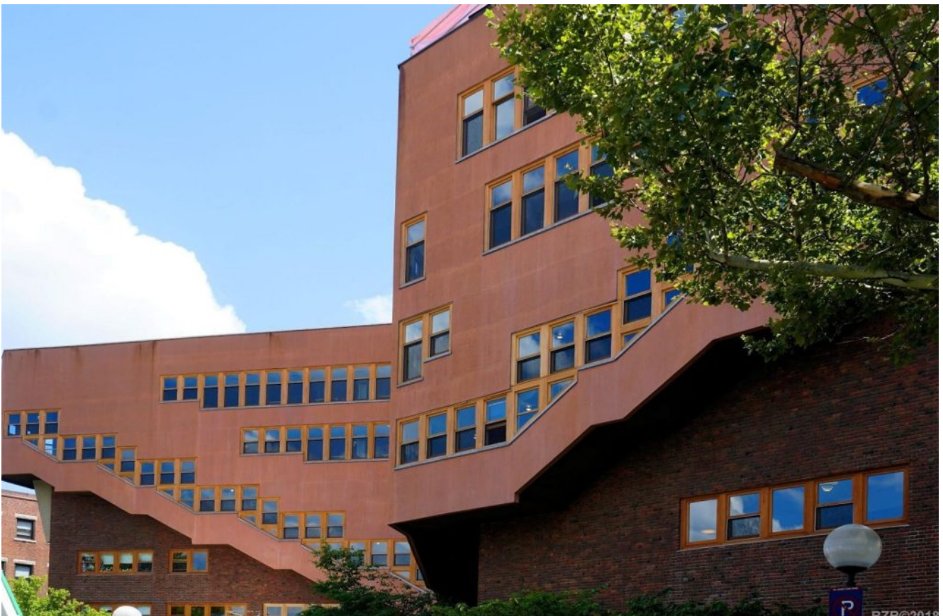
MIT Baker Dormitory – Akvar Aakti

Per il giudizio critico, l'architettura, che è sempre un evento reale, non è mai solo il suo disegno. È anche e principalmente la costruzione dei manufatti che definiscono un luogo, uno spazio, e compongono un posto in cui vivere. Il disegno (di progetto) ci dovrebbe dare soprattutto l'indicazione grafica e tecnologica di come realizzarlo.