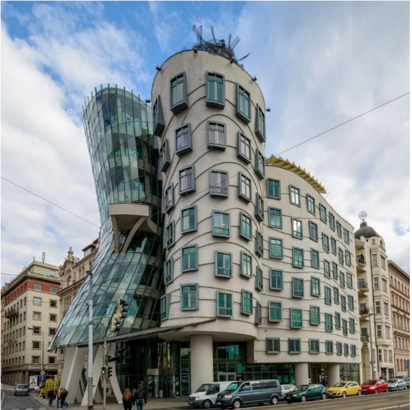
Frank Gehry, dancing house, 1972-1975

L'architettura è ritenuta socialmente un'attività pericolosa.