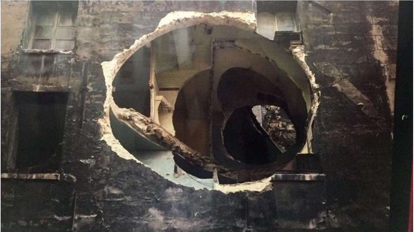
Gordon Matta Clark, Conical Intersect, 1975

L'architettura, e l'arte in genere, non devono avere valore per sé, ma devono essere degne della nostra considerazione. Il valore dell'arte, infatti, nel modo in cui generalmente lo consideriamo, non serve all'arte ma solo a chi la possiede materialmente. Il nostro giudizio è sempre molto influenzato da tale condizione materiale la quale, spesso, ricorre ad artifici retorici per giustificare la dote mercantile. Anche il concetto di bellezza ricade in questa considerazione, acquisendo pertanto in tale contesto anche un valore morale, anch'esso inutile per l'arte ma utile per il riscatto etico di chi la possiede.