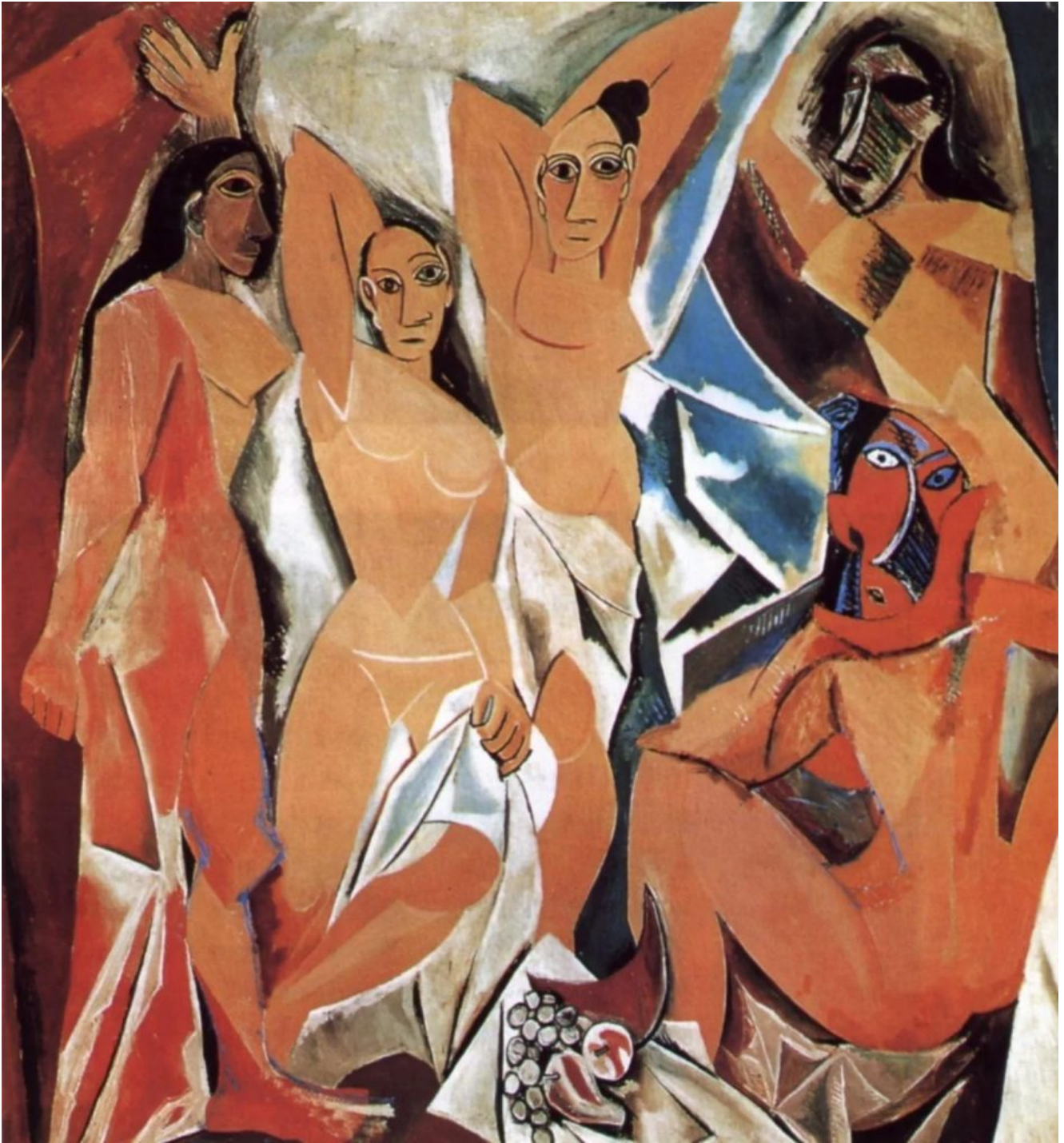
Pablo Picasso - Les Femmes d'Alger - 1935

Vale più la tutela del paesaggio o la libertà d'espressione delle persone che lo vivono?